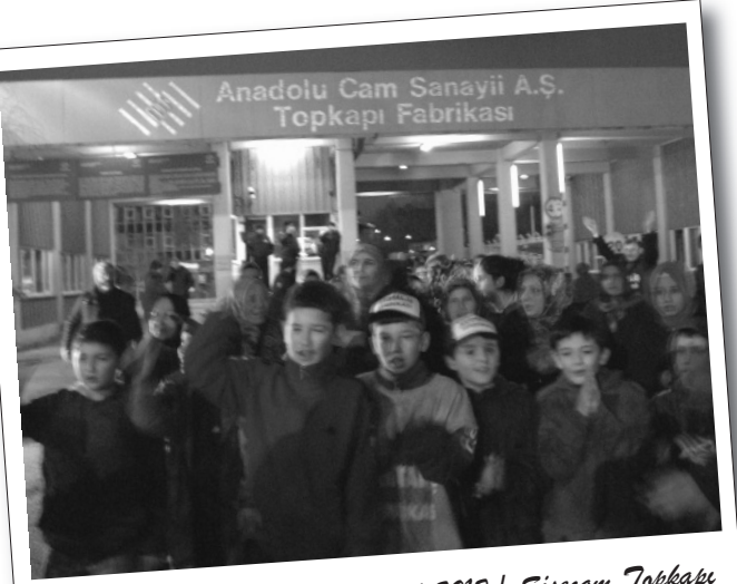
31 Aralık 2012 | Şişecam Topkapı

Sermaye, daha fazla sömürü ve sefalet dayatarak bir yılı daha bitirirken, işçiler yeni yılı direnişlerinin başında karşılayarak mücadeleyi büyütme sözü verdiler. Fabrikayı işgal ederek direnişe geçen Şişecam Topkapı işçileri, hakları için direnen Hey Tekstil işçileri yeni yılı direniş ateşinin başında girdiler. Yeni yıla direnişle giren işçiler, başlattıkları mücadelede kararlılıklarını sürdürdüklerini bir kez daha gösterdiler.