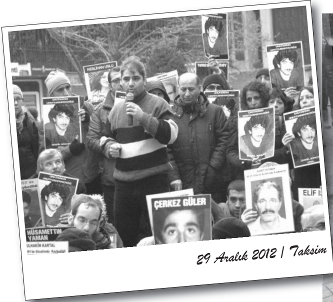
29 Aralık 2012 | Taksim