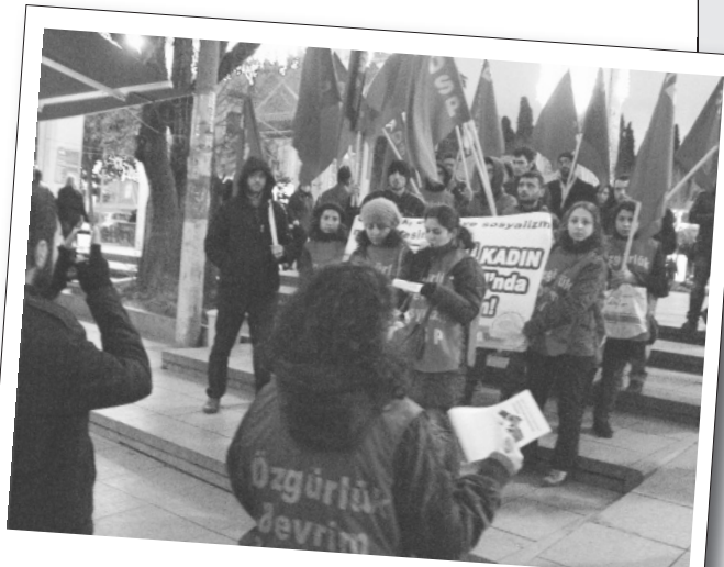
30 Aralık 2012 | Bakırköy