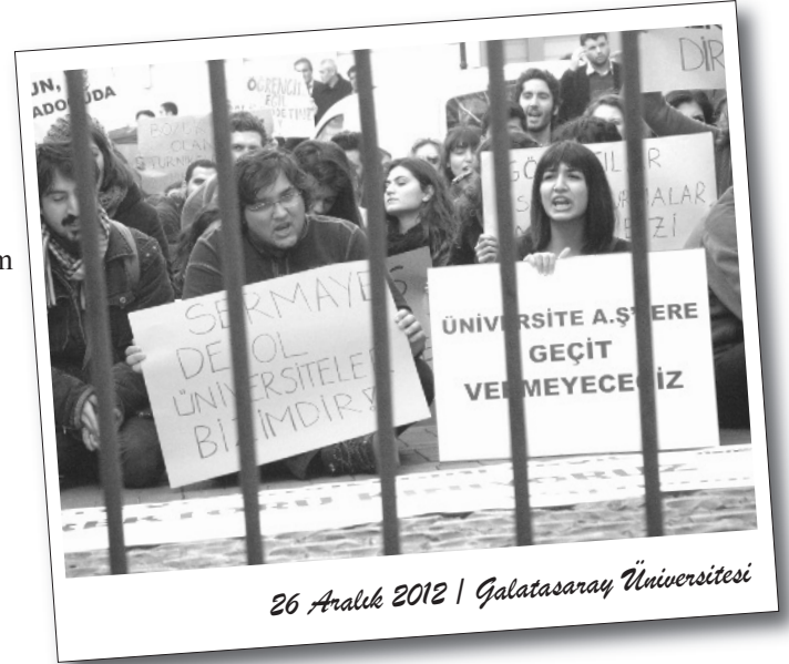
26 Aralık 2012 | Galatasaray Üniversitesi

Namık Kemal Üniversitesi Rektörlüğü'nün ODTÜ