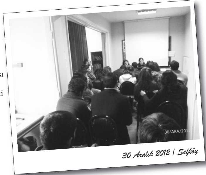
30 Aralık 2012 | Sefiköy