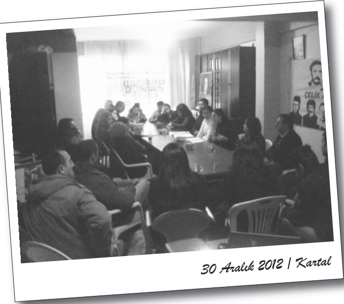
30 Aralık 2012 | Kartal